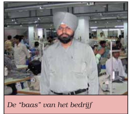
De "baas" van het bedrijf

Desondanks voor mij een boeiende periode die ik niet graag gemist had en een gevoel dat je toch met je oude expertise iets hebt kunnen betekenen voor mensen in de ontwikkelende landen.