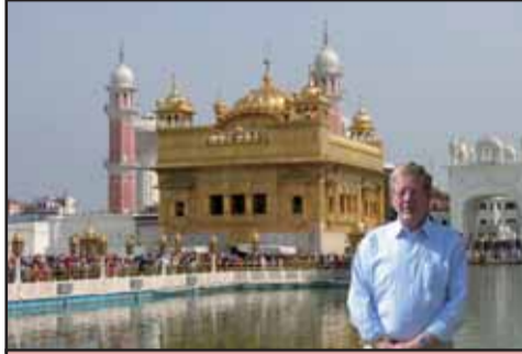
De prachtige Golden Tempel in Amritsar (niet ver van Ludhiana)

PUM, oorspronkelijk "Project Uitzending Managers" is een Nederlandse organisatie die is opgezet voor ondersteuning van ontwikkelende landen. De uitdagende opdracht die PUM zich heeft gesteld luidt: Ondernemen tegen armoede. De organisatie van PUM bestaat uit een beperkte vaste staf die wordt ondersteund voor de uitvoering van projecten door ca. 4000 vrijwilligers, werkzaam in 76 landen. Deze vrijwilligers zijn gepensioneerde managers en experts uit het bedrijfsleven die hun expertise ter